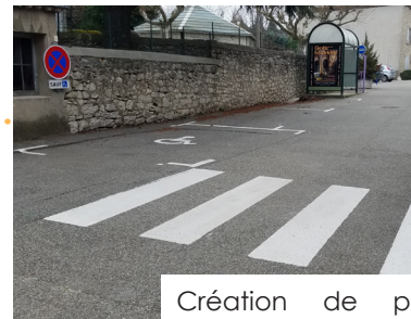
Création de places de parking rue de la bascule.