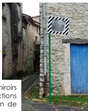
Mise en place de miroirs à différentes intersections pour une sécurisation de sortie de véhicules.