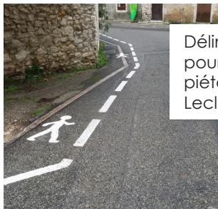
Délimitation de la voirie pour un passage de piétons Avenue Maréchal Leclerc.